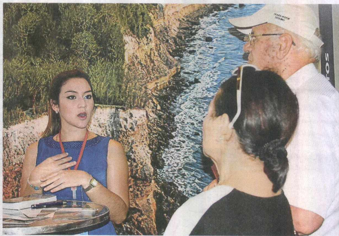
LOS STANDS CUENTAN CON asesores que ofrecen información a los asistentes sobre los proyectos de interés.

La entrada al público es gratuita, de 3 p.m. a 10 p.m.